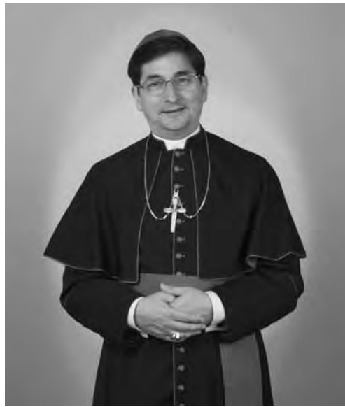
Obispo Joseph Tyson

Todo lo demás en esta edición de El Católico de Washington Central realmente fluye de la libertad religiosa que gozamos como Iglesia aquí en los Estados Unidos. Esa expresión de libertad religiosa es lo que ustedes pueden ver en la reciente renovación del espacio de culto divino en la Parroquia St. Rose of Lima en Ephrata como también el cuidado externo de la escuela, la parroquia, y, más recientemente el nuevo trabajo de pintura en la rectoría. Nuestros