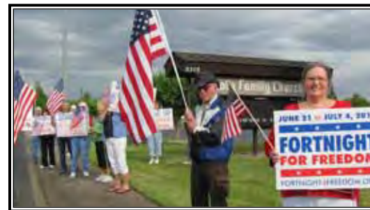
Los católicos se reunieron frente la Iglesia de la Santa Familia en Yakima para observar la Quincena por la Libertad.

Localmente, un grupo de católicos de varias parroquias de Yakima, incluyendo numerosos partidarios pro-vida, se reunieron en las mañanas en el