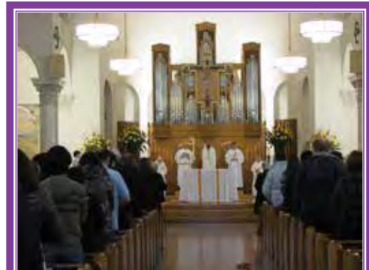
La Catedral estaba casi llena durante la Misa para el Día Mundial de la Vida Consagrada.