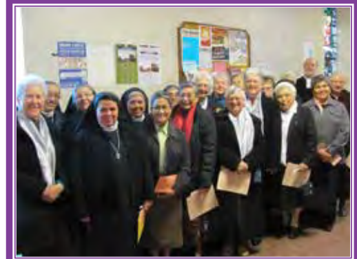
Las Religiosas de la Diócesis de Yakima se reúnen para procesar en la Misa, donde tuvieron la oportunidad de renovar sus votos.