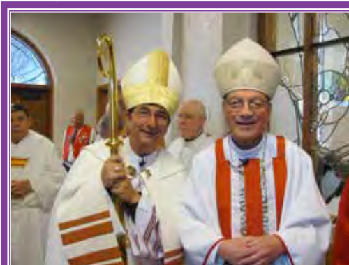
El Obispo Joseph Tyson, a la izquierda, y el Obispo Emérito Carlos Sevilla, S.J., se detuvieron por un momento antes de la Misa. El Obispo Sevilla celebró su aniversario de 25 años como obispo ese día.