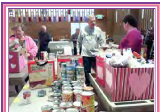
Escuelas católicas locales, negocios y personal de Servicios de Voluntarios asistieron para empacar y entregar las cajas de productos de uso personal, alimentos básicos y otros artículos a personas necesitadas.