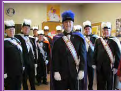
El guardia de honor de Los Caballeros de Colón reunidos antes de la Misa el 2 de febrero en St. Paul Cathedral, celebrando el Día Mundial de la Vida Consagrada.