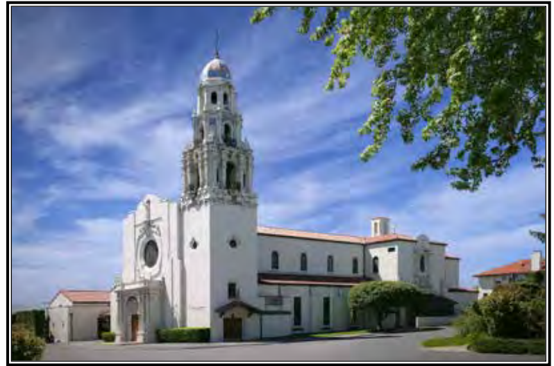
St. Paul Cathedral: reflejando la comunidad.

La escuela original de St. Paul, que abrió sus puertas en 1914, sería reemplazada por