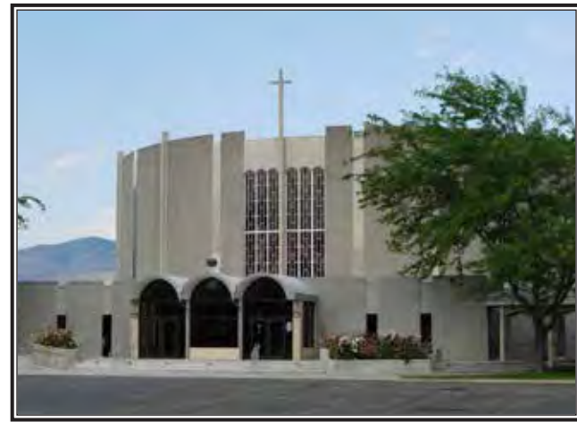
Iglesia Holy Apostles

"Estoy muy contento aquí," dijo él. "Esta gente me ha enseñado a ser un buen apóstol."