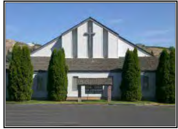
La Iglesia Our Lady of Lourdes ofrece una atmósfera amistosa y bondadosa.

“Es un buen augurio para el futuro,” sugirió él.