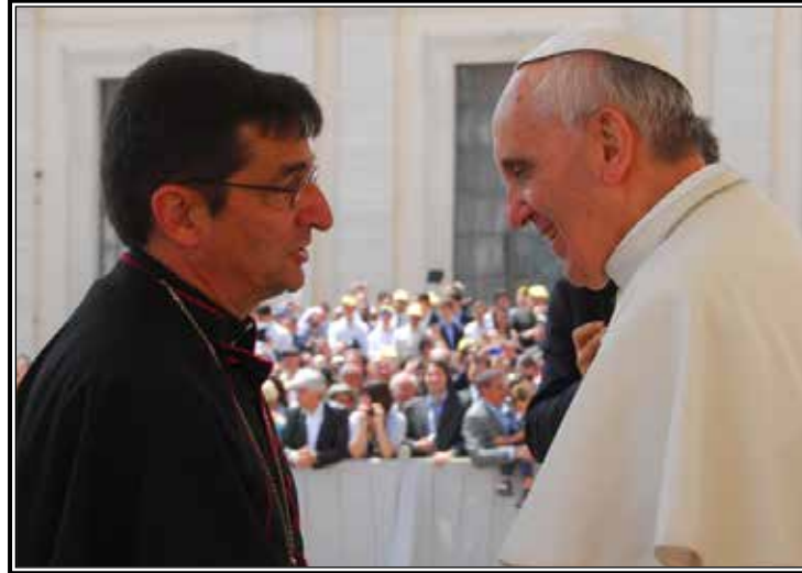
El Obispo Joseph Tyson se reúne brevemente con el Papa Francisco durante su visita a Roma a principio de este mes.

"Estuvimos muy contentos de que el Obispo Tyson se uniera a nosotros para hablar sobre temas del día que están a la vanguardia de las preocupaciones que enfrentan los directores