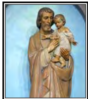
Esta estatua de San José bendice a la parroquia St. Joseph Church en Yakima.

Columna Invitada por la Hermana Constance Veit, Little Sisters of the Poor