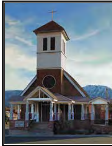
La parroquia St. John The Baptist Church en Cle Elum es “brillante con hermosos vitrales.”

“Puede que sean pequeñas, pero su tamaño se compensa con entusiasmo. Existe un fuerte sentido de comunidad y compromiso.”