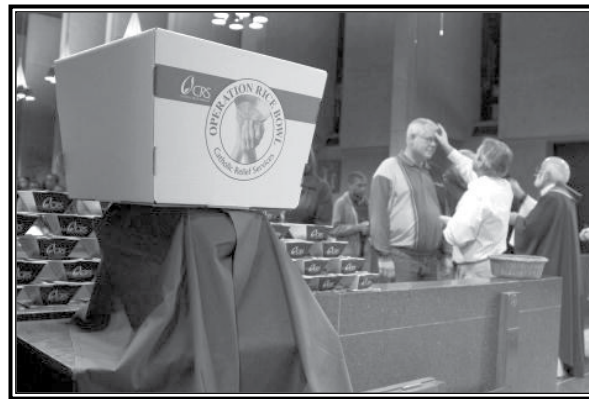
Donaciones al programa Rice Bowl es uno de los medios para hacer un sacrificio Cuaresmal.

Si quiere ver algunas recetas simples, sin carne recomendadas por CRS, o informarse más sobre el programa Plato de Arroz, visite: www.crsricebowl.org .