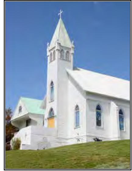
La parroquia Immaculate Conception Church, ubicada en Roslyn, tiene “un espíritu de santidad.”

“Es la gente la que hace la iglesia,” dijo ella, añadiendo que el edificio histórico de Immaculate