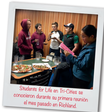
Students for Life en Tri-Cities se conocieron durante su primera reunión el mes pasado en Richland.

Los grupos de Estudiantes pro Vida de Washington Central también han planificados reuniones para el mes de enero.