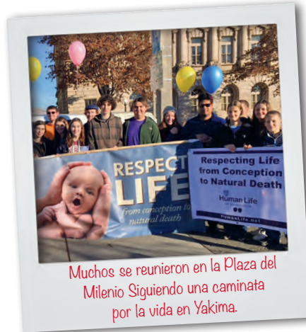
Muchos se reunieron en la Plaza del Milenio Siguiendo una caminata por la vida en Yakima.

Una tercera caminata comenzará a la 1 p.m., el sábado 26 de enero en