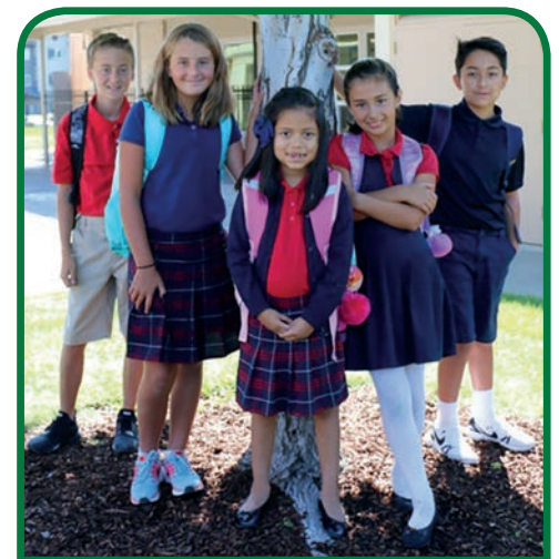
Estudiantes de la escuela Christ the Teacher en Yakima frente a su nueva escuela.

Las ocho escuelas católicas de Washington Central compartirán $139,750 en Ayuda con la Colegiatura (TAP) apoyando a 147 estudiantes. Estos fondos son dirigidos a los estudiantes que tienen la mayor necesidad financiera, haciendo que las escuelas católicas sean accesibles a todas las familias que deseen una educación católica para sus hijos. Todas las escuelas combinan estos fondos con apoyo de becas basado en la escuela para hacer que la colegiatura sea más accesible a las familias con dificultades. La Escuela Christ the King en Richland, la Escuela Christ the