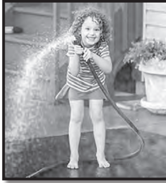
Ya que jugar con el agua es una actividad favorita durante el verano, sea cuidadoso y tome precaución con la temperatura del agua para proteger a los niños.

El agua en la manguera del jardín que ha estado en el sol puede alcanzar los 190 grados Fahrenheit. Esa temperatura es casi hirviendo y puede causar una quemadura instantánea al hacer contacto con la piel, especialmente la piel más delicada de los niños pequeños. Las quemaduras de segundo y tercer grado no son raras en los