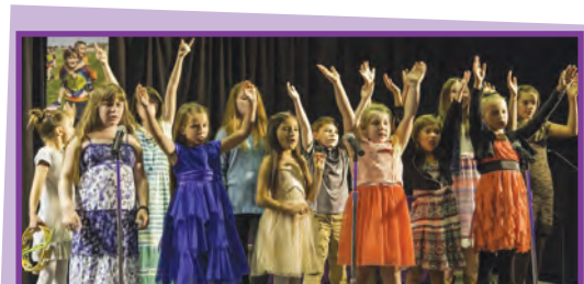
Los miembros del coro de niños de la Iglesia Our Lady of Lourdes en Selah cantaron sobre la fe.

"Rindo homenaje al trabajo de los maestros, administradores, párrocos.....Gracias a todos y cada uno de ustedes," concluyó él.