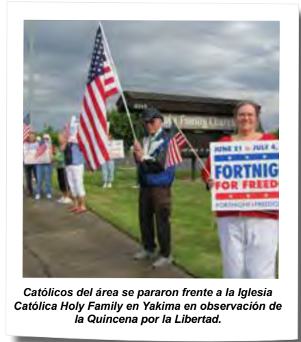
Católicos del área se pararon frente a la Iglesia Católica Holy Family en Yakima en observación de la Quincena por la Libertad.

El Papa Francisco también ofreció estas palabras de aliento para todos nosotros, el 21 de diciembre, 2014: "Queridos hermanos y hermanas que valientemente dan testimonio a Jesús en la tierra bendecida por el Señor, nuestro consuelo y nuestra esperanza es Cristo mismo. Os animo, pues, a permanecer cerca de él, como las ramas de la vid, en la certeza de que ninguna tribulación, angustia o persecución puede separarnos de él (cf. Rom 8,35.) ¡Que las penas que actualmente soportan fortalezcan la fe y la fidelidad de todos y cada uno de vosotros!"