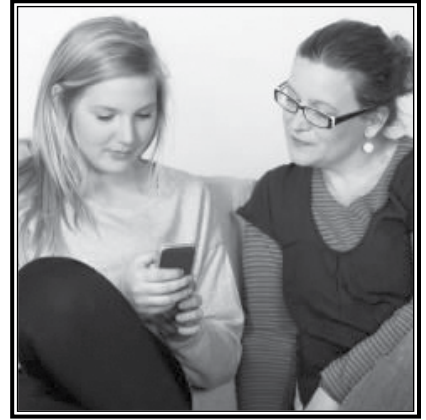
No deje que Facebook interfiera con su vida.

Nota: La Diócesis de Yakima está introduciendo Virtus, un entrenamiento de ambiente seguro para todo el clero, empleados y voluntarios que trabajan con menores por un periodo de tres años.