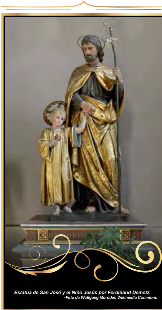
Estatua de San José y el Niño Jesús por Ferdinand Demetz.

Monseñor Ecker ha sido uno de los organizadores del Equipo XY, un grupo ecuménico de hombres que se ha reunido en Yakima desde el 2013 “desafiando a los hombres a vivir su fe abiertamente” y a ser “buenos padres y esposos.”