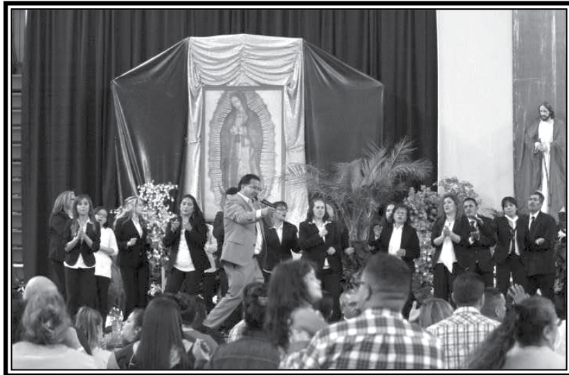
Muchos asistieron al Congreso de 2014.