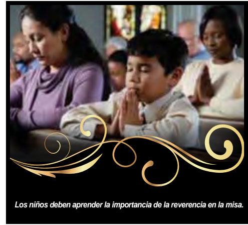
Los niños deben aprender la importancia de la reverencia en la misa.

Dios abre Sus brazos a nosotros y nos recibe a través de la Misa. Reflexionemos ese espíritu de amor a través de la consideración para él y para los demás.