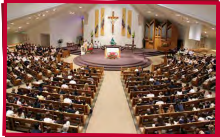
Los estudiantes de la escuela Christ the King en Richland se reunieron para su Misa semanal de cada jueves.