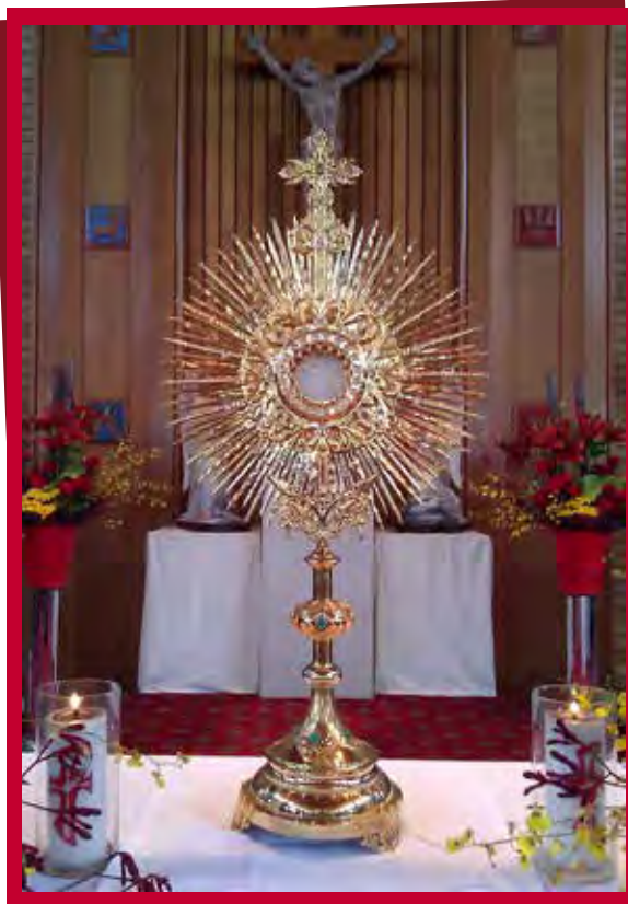
La Adoración Eucarística es una manera significativa para nutrir su fe.

5. Ayudar detrás de escena en tu parroquia. Muchas funciones en la parroquia