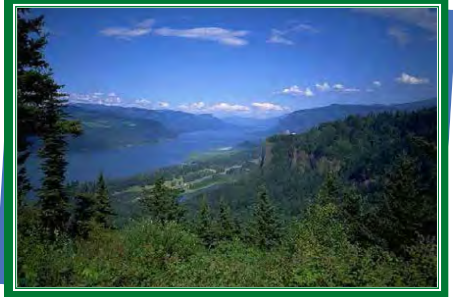
El río Columbia es un legado para las futuras generaciones.

"El Río Columbia es una fuente extraordinaria de corresponsabilidad porque es muy complejo," dijo el Obispo Skylstad. Nos ofrece