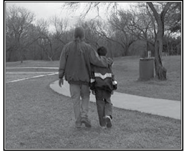
Hay maneras de ayudar, cuando parece perdido un hijo.

Nota: Si ve a un niño que usted reconoce como un niño que está perdido, basado en información de los medios tales como reportes de prensa, alertas de niños perdidos, o volantes distribuidos por autoridades policíacas, llame inmediatamente a los oficiales de la policía y siga sus instrucciones.