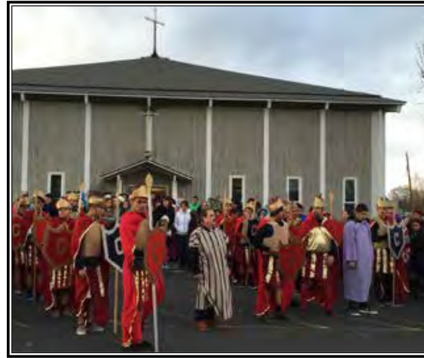
Las Estaciones de la Cruz en vivo fueron presentadas el Viernes Santo en la Iglesia St. Juan Diego.