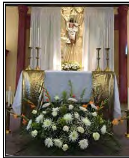
Los pilares incluidos en el santuario ayudan a resaltar el altar, tal como se ve en el Domingo de Pascua.