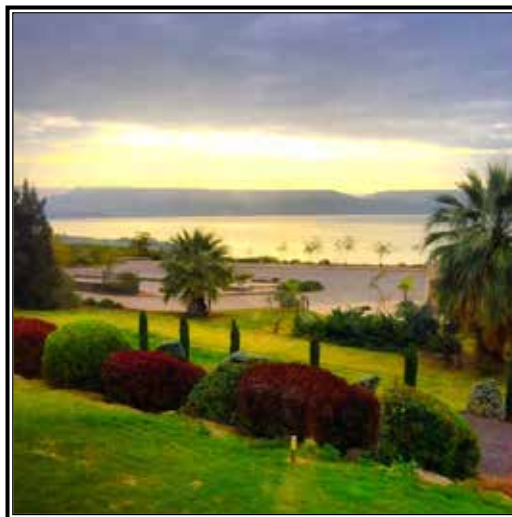
Jerusalén muestra desde el lado de la colonia judía mirando hacia la colonia de musulmanes.

Mientras el grupo viajaba por Jerusalén, Jericó, Nazaret, Belén y el Mar de Galilea, otros miembros del grupo también experimentaron momentos