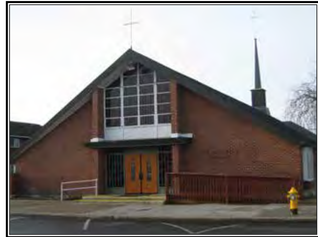
La Iglesia St. Aloysius en Toppenish

"Todos están dispuestos a hacer lo que sea necesario," dijo ella. "Eso hace que la iglesia sea maravillosa, una bella iglesia."