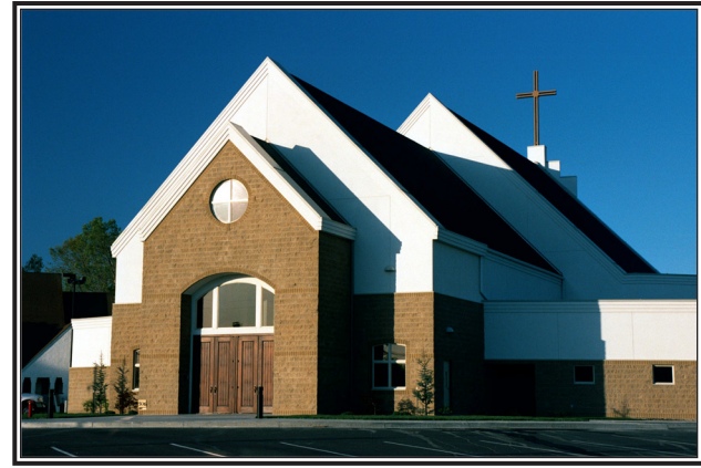
Muchas culturas y tradiciones mezclan en la Parroquia de St. Joseph.

“Yo he escuchado a la gente decir que se siente un sentido de reverencia cuando ellos entran a la iglesia, un fuerte sentido de continuidad que ha venido a través de los años,” dijo ella.