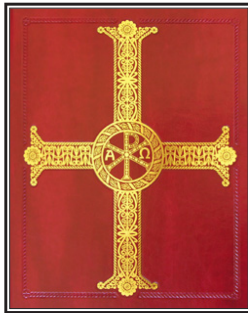
Cobertura de frente del nuevo Misal Romano, de Liturgy Training Publications.

antes. En las palabras de “Comprendiendo los Textos Revisados de la Misa,” una