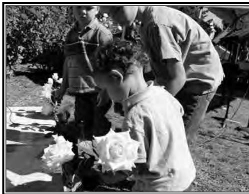
Los jóvenes locales colocaron flores en el monumento de los niños abortados.

El evento fue organizado por Wenatchee Right to Life (Derecho a la Vida de Wenatchee), asistido por los Caballeros de Colón de Holy Apostles.