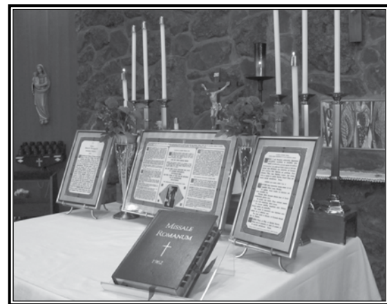
El tradicional altar tiene una elegancia sencilla.