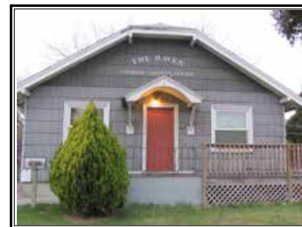
El refugio Haven está ubicado en la avenida South 16 en Yakima y ofrece convivencia social para jóvenes Católicos.