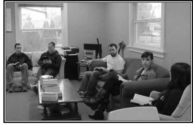
Un grupo de jóvenes reunidos en el refugio Haven se unen para una noche de estudio de Biblia.

Para más información sobre The Haven, visite su sitio en Facebook o llame a la Catedral St. Paul al (509) 575-3713.