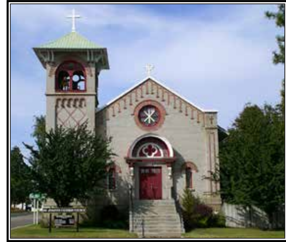
La Parroquia St. Joseph en Waterville tiene una larga historia de vivir la Fe.

"La comunidad tiene una estabilidad tranquila, una constancia de que es auténtica. La gente aquí es muy dedicada a su fe y a su iglesia," observaba el Padre Norman.